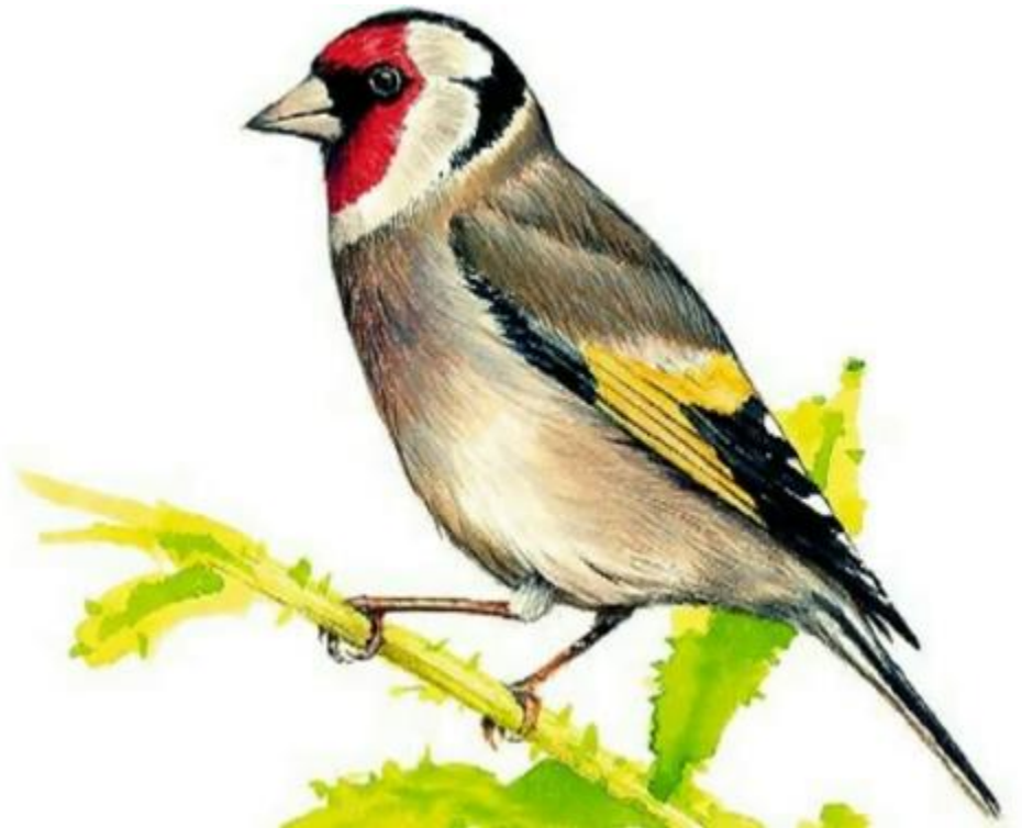
Carduelis carduelis ( Linnaeus, 1758 )